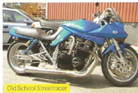
Old School Streetracer

Medlemmarna på vår hemsida www.bike.se kan enkelt ladda upp tio egna bilder . Här är ett urval från tre som har gjort det.