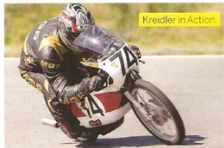
Kreidler in Action.